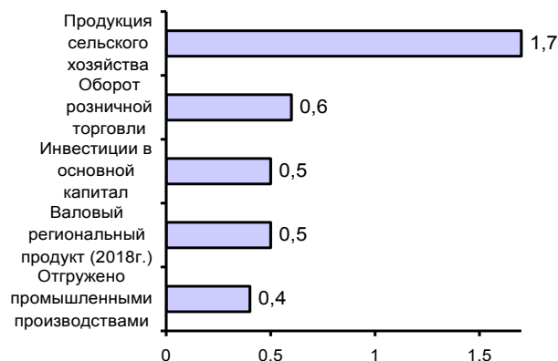
УДЕЛЬНЫЙ ВЕС ОБЛАСТИ В ОБЩЕРОССИЙСКИХ ОСНОВНЫХ ЭКОНОМИЧЕСКИХ ПОКАЗАТЕЛЯХ в 2019г.